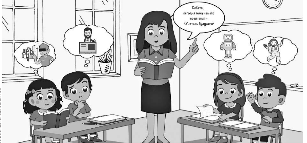
РИСУНОК ЕКАТЕРИНЫ КАСАКИНОЙ

Общая сумма выделенных средств — 10 млн рублей. Из них федеральное финансирование — около 8,5 млн. Почти 1,4 млн —