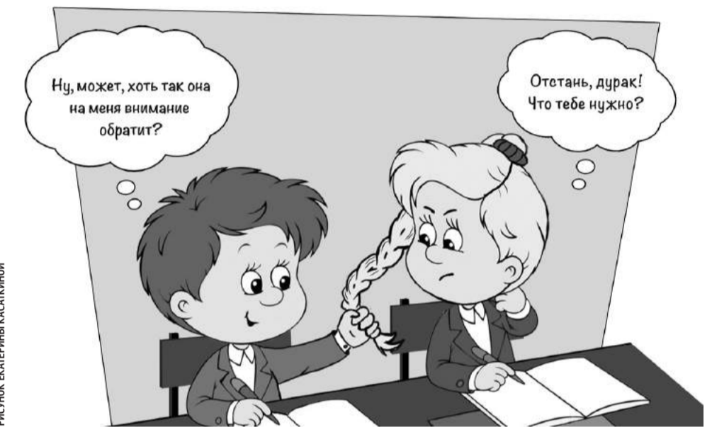
РИСУНОК ЕКАТЕРИНЫ КАСАКИНОЙ

Наши подростки переживают чувства влюблённости, первой любви, дружбы — это прекрасные человеческие чувства и отношения,