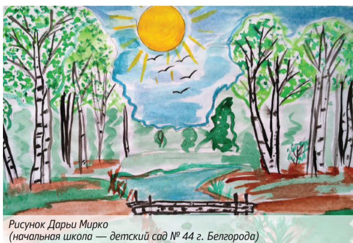
Рисунок Дарьи Мирко (начальная школа — детский сад № 44 г. Белгорода)