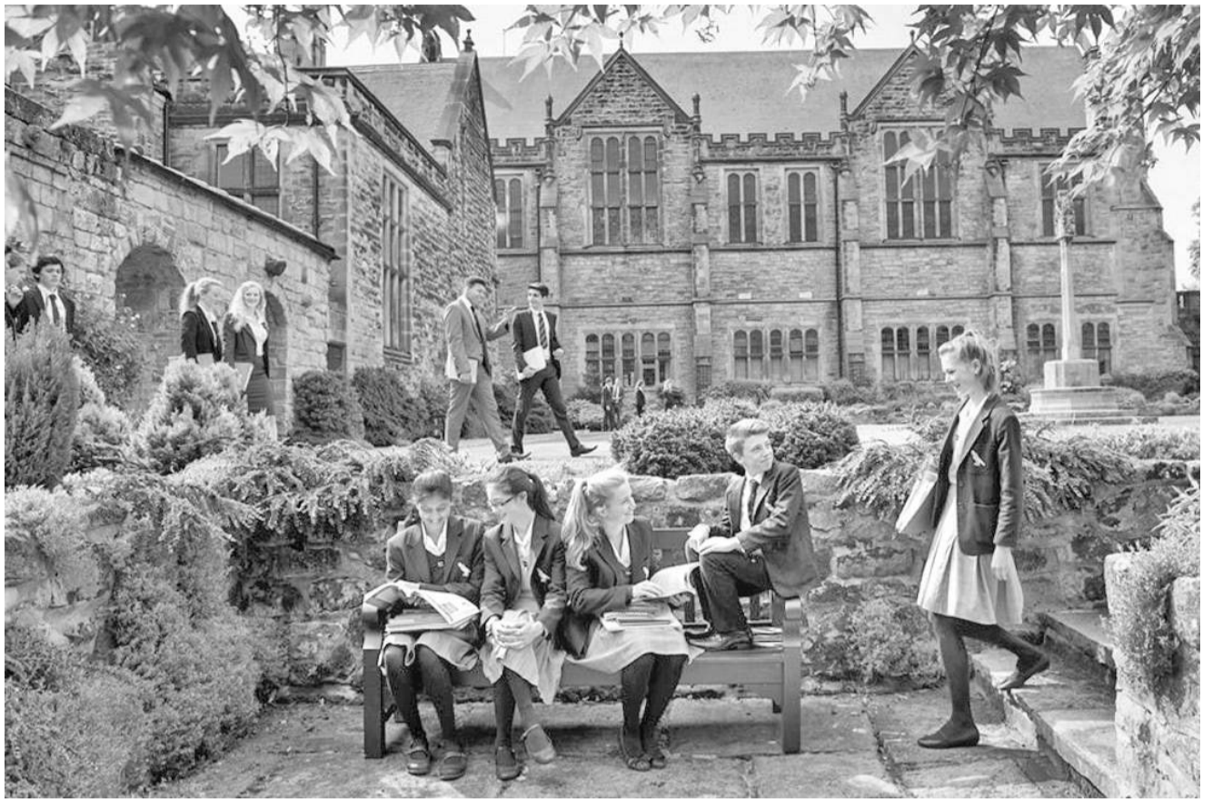
В некоторых канадских школах от формы и не думали отказываться