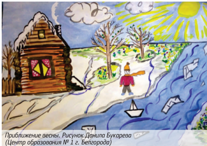
Приближение весны. Рисунок Даниила Букарева (Центр образования № 1 г. Белгорода)