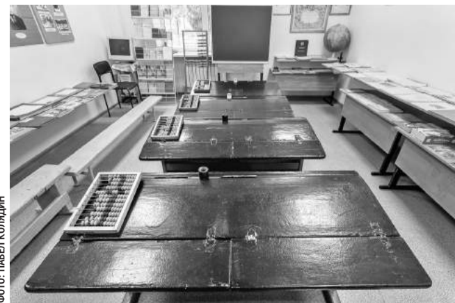
Зал истории образования в музее Томаровской школы № 1

С тех пор все уроки русского языка, литературы и беседы о советском обществе проходили без курьёзов. Молоденькая учительница даже съездила в областное управление кинофикации. Договорилась каждую неделю по пятницам привозить в колонию фильмы.