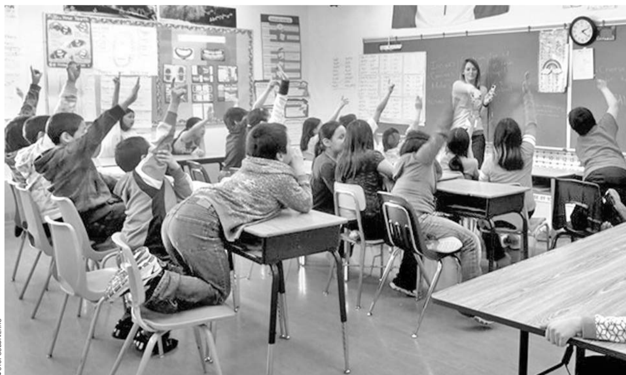
Занятия в одной из канадских школ