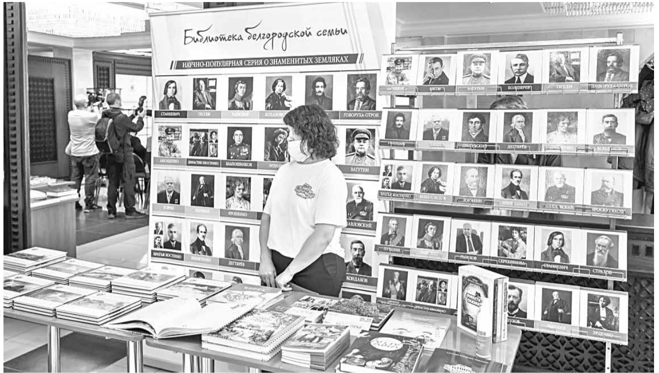
В последние годы в Белгородской области выпускается много качественных краеведческих книг, которые тоже можно изучать на уроках родной литературы

Задача нового предмета — познакомить школьников с произведениями фольклора, русской классики и современной литературы, которые не входят в список обязательных произведений, представленных в программе по предмету «Литература», но при этом максимально ярко воплотили национальную специфику русской литературы и культуры.