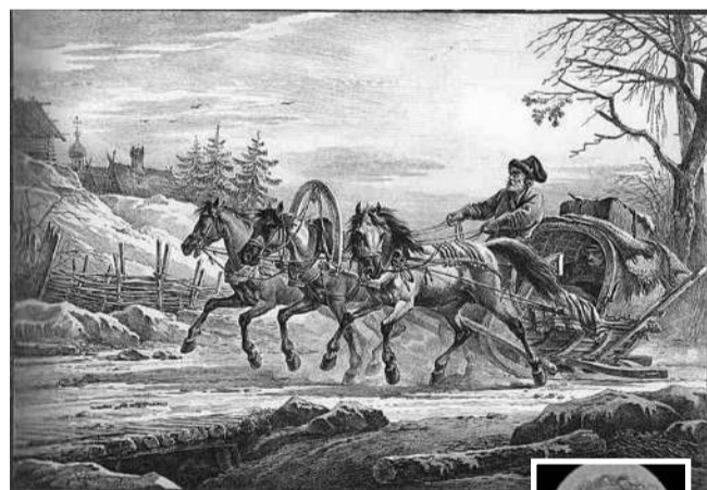
Настоящая кибитка — это крытая повозка, как на этой литографии Александра Орловского «Путешественник в кибитке, или Сани, запряжённые тройкой» (1819, Киевская картинная галерея)

Другие ученики назвали кибитку «птичкой», летящей с Кубы и крыльями поднимающей снег; «поездом, который очень быстро едет, и поэтому снег летит вверх и вниз» и даже «кибернетической, шустрой тёткой». Ямщик, по их мнению, оказался «дядей, профессия которого — таскать ящики»; человеком, роющим ямы, вероятно, карликом, «потому что сидит на чём-то маленьком и прячется в ямку».