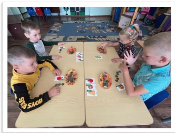
Экономическая игра «Магазин»