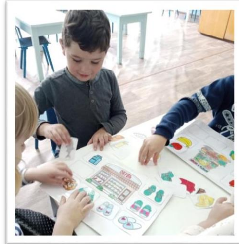
Дидактическая игра «Угадай, где продается»