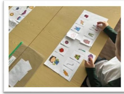
Дидактическая игра «Хочу и надо»