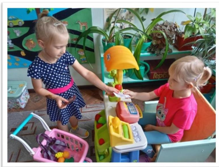
Сюжетно - ролевая игра «Магазин»