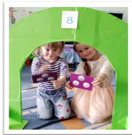
Дидактическая игра «Пройди в ворота»