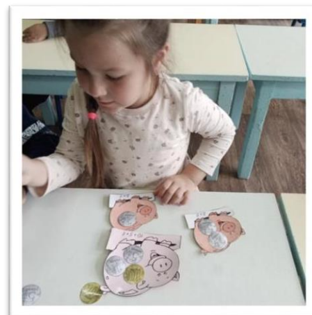
Дидактическая игра «Копилка»