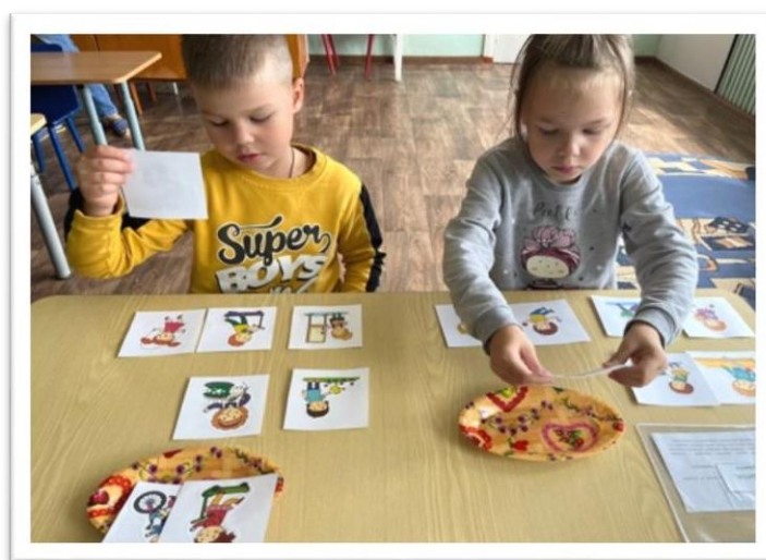
Дидактическая игра «Кто трудится, кто играет»