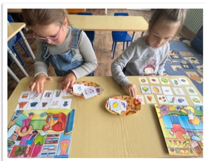
Дидактическая игра «Угадай, где продается»