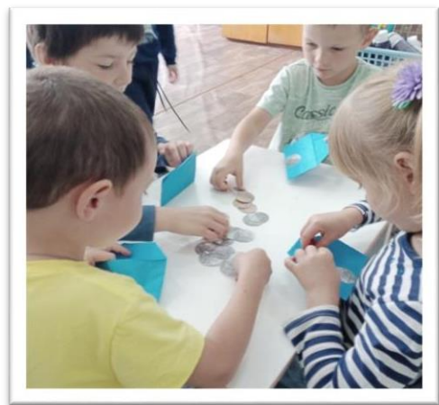
Дидактическая игра «Разложи монетки в кошельки»