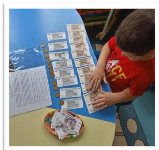
Дидактическая игра «Школа банкира»