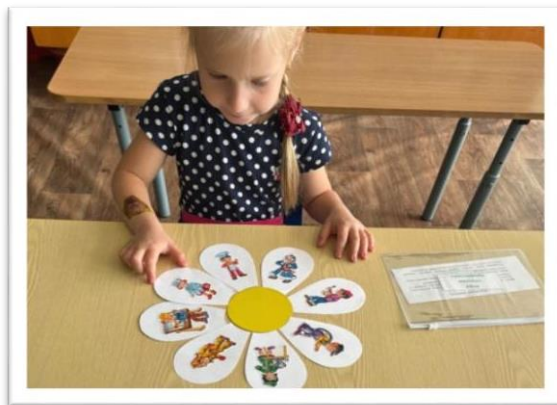
Дидактическая игра «Назови профессию»