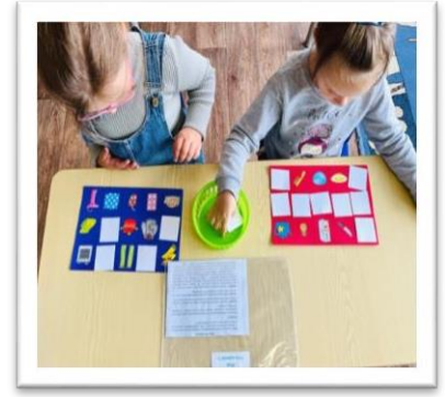
Дидактическая игра «Что важнее»